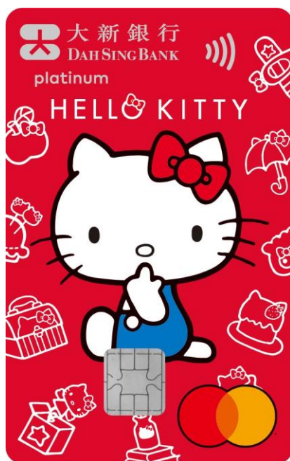
全新大新 Hello Kitty 信用卡

全新大新 Hello Kitty 信用卡以 70 年代經典復古 Hello Kitty 造型構思, 配合全新限量直版設計, 絕對是 Hello Kitty 迷必搶的珍藏品。