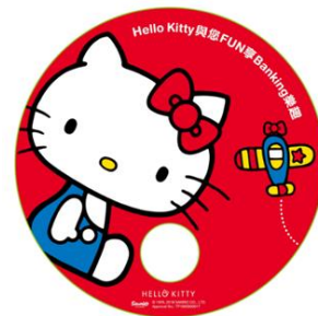
大新銀行 Hello Kitty Fun Banking – 分行佈置及免費紙扇