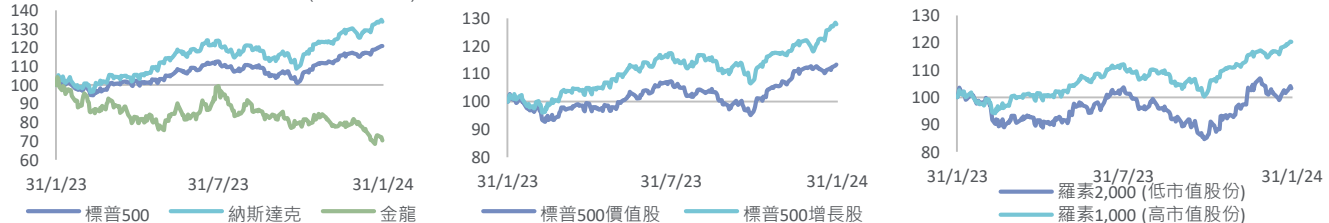
主要指數及風格指數走勢 (一年前=100)